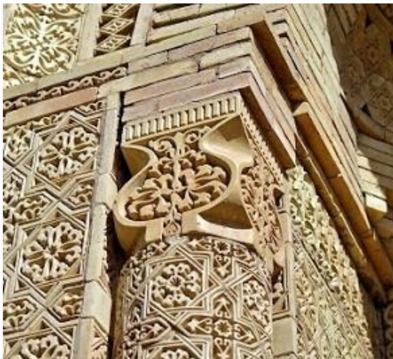
3-сурет – Кесененің кіре берісіндегі колонна [Ақпарат көзі: https://www.youtube.com/watch?v=0_EaH3qdI4k% ]

Жалпы композиция сол кездегі X – XI ғасырлардағы Ислам архитектурасындағы композициялық шешімдерге ұқсас. Осы тұста ерекше сараптауды қажет ететін – колонналардың төбесін көмкеріп тұрған капительдері. Бұл капительдер – жалпы көлемі квадратқа сыйғызылған, әр бетінде жүрекше тәріздес пішіннің іші қазақ оюы қиыстырылған, раушан гүлге ұқсас бірегей ойлап табылған сәулеттік туынды. Осы капительдің қырлары қасынан қарағанда иреленген жылан сияқты, ал жанынан қараса аузы ашылып тұрған кобраны елестететін пішін көрінеді. Бұл аллегориялық символ – Айшаны сәукеледен жылан шығып, шағып өлтіргенін бейнеленіп тұрған тәрізді. Капител еуропалық классика түсінігіндегі архитектуроналық орны, немесе ислам сәулеттік тіліндегі әшекейлік міндетін атқара тұрып, ерекше қазақи сымбатта мүсінделген теңдесі жоқ үйлесімге ие шығарма. Болашақ қазақ сәулетінің көркемдік тілін қалыптастыруда бұл туындының алатын орны зор, сондықтан ерекше зерделеп түсіне зерттеуді және эстетикалық мәнін болашақ сәулет өнерінде дамыта қолдануды талап етеді [3] (3-сурет).