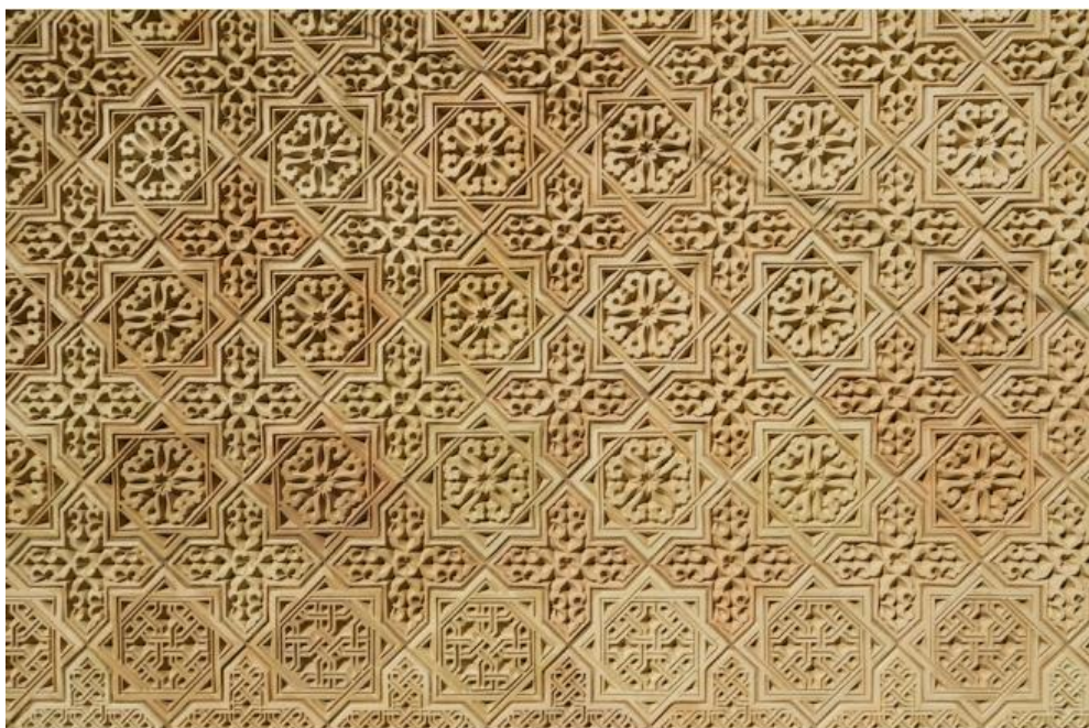
4-сурет – Айша-Бибі кесенесіндегі тақтайшалар

Заманауи деректерге жүгінсек, қазақ сәулет өнерінде бұндай сәулеттік шешім тек Айша Бибі кесенесінде ғана кездеседі. Осындай шешіммен, осындай көркемдікпенен, осындай сауатты түрде архитектура құру немесе туындау тарихта кездейсоқ құбылыс емес екені даусыз және осындай бірегей шығарма туындау ол бір күннің жұмысы емес екені белгілі. Сондықтан, XII-XIII ғасырлардағы қазақ сәулет өнерінде бұл эстетикалық шешімге ұқсас, осындай құрлыс технологиясы қолданылған архитектура мүмкін басқа да сәулеттік туындыларда пайдаланылған болуы заңды, тек олар біздің заманға дейін сақталмаған шығар. Бізге жеткені тек Айша Бибі кесенесі ғана болуы әбден ықтимал.