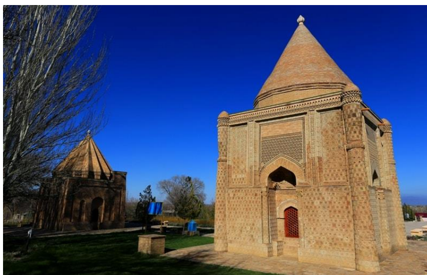
1-сурет – Айша-Бибі және Бабаджа хатун кесенесі

Айша бибі кесенесі XI-XII ғасырлардағы сәулет өнерінің көрнекті ескерткіші болып табылады. Ол Жамбыл облысы Жамбыл ауданында Айша бибі ауылында орналасқан. Тарихи деректер бойынша Кесене құрылысын 1897 жылы В.А. Каллаур, 1938-1939 жылы А.Н. Бернштам, 1953 жылы Т.Қ. Бәсенов бастаған Қазақстан ғылым академиясының экспедициясы зерттегені белгілі. Кесене бірнеше рет қалпына келтірілді [1] (1-сурет).