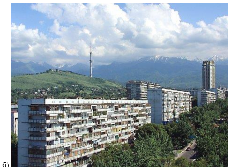
Рисунок 3 – Проспект Ленина а) 1970-е гг. б) проспект Достык 2000-е гг..