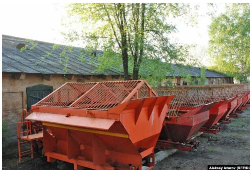
Рисунок 2 – Оборудование «Алматы Тазалык» у здания казарм Верненской крепости.

Здесь вопрос стоит не просто о реконструкции или ремонте, а о полной утрате, т.е. сносе, не просто зданий рядовой застройки (в основном сносу подвержены здания жилой срубной архитектуры), но важных объектов, связанные с историей культуры. Яркой иллюстрацией этой проблемы служат здания казарм Верненской крепости, территория которой используется для размещения коммерческих предприятий (рис. 2).