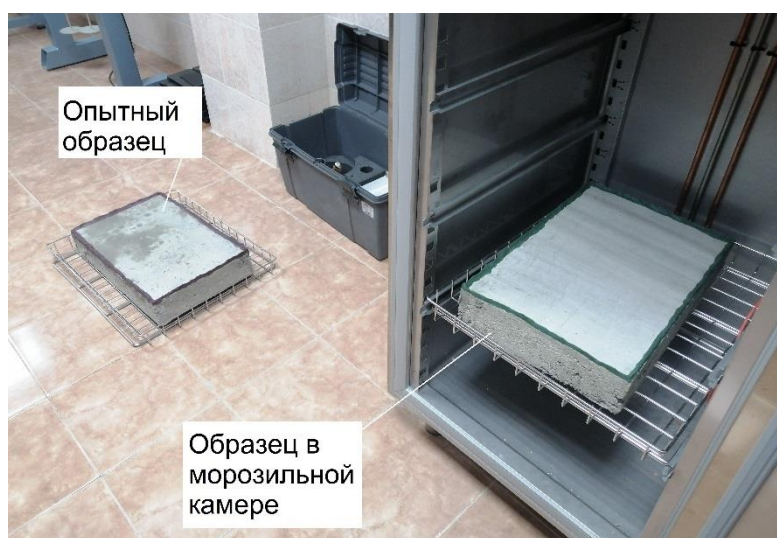
Рисунок 2 – Опытные образцы

В первом случае по контуру рабочей поверхности был выполнен бортик для удержания необходимого количества воды на поверхности образца. Во втором случае, для чистоты эксперимента, климатическим воздействиям была подвергнута только рабочая поверхность образца, остальные грани образца (боковые и нижняя) были изолированы теплоизоляционным материалом (рис. 2).