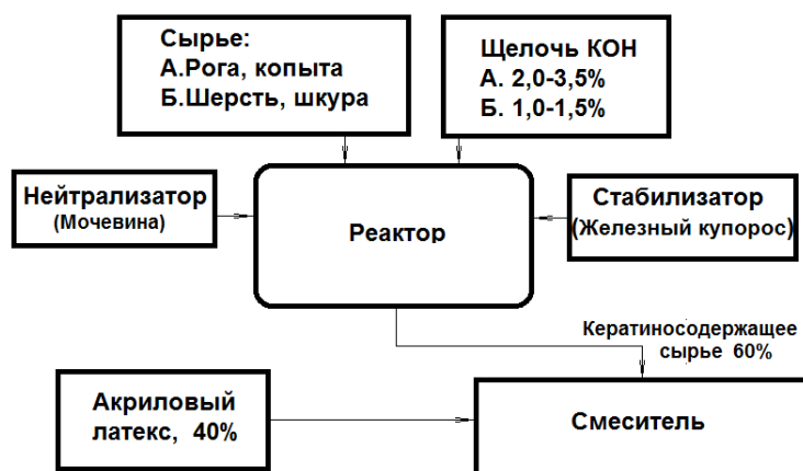
Рисунок 1 – Технология производства пропиточного состава [материал авторов]

В реактор загружается 1/3 воды и дозированное количество кератинового сырья. Далее в реактор загружается каустическая сода или его водный раствор требуемой концентрации. Соотношение (кератиновое) сырье: жидкая фаза – 1:3, затем сюда же в реактор загружается требуемое количество мочевины (карбамида) и вводится оставшаяся часть воды, т.е. ее 2/3 часть. После этого реактор герметично закрывается, и загруженное сырье подвергается тепловому воздействию. Температура в процессе гидролиза не должна превышать 135°C. Продолжительность гидролиза зависит от вида кератинового и может составлять 4-8 часов. После завершения процесса гидролиза гидролизат должен остыть до температуры окружающего воздуха. Из остывшего раствора гидролизата отбирают 1 литр пробы, замеряют начальное рН, приступают к его нейтрализации сернокислым железом ( \text{Fe}_2(\text{SO}_4)_3 ). После нейтрализации полученного гидролизата, он подвергается фильтрованию пропусканием продукта через фильтр-пресс. Затем кератиносодержащий состав в смесителе перемешивают с акриловым латексом, в процентном соотношении 60:40, соответственно.