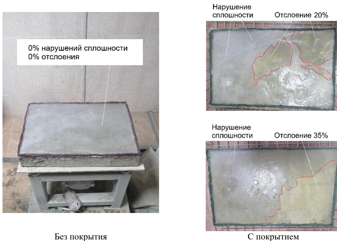
Рисунок 4 – Образцы, после моделирования термического напряжения [материал авторов]

На рис. 4 представлены результаты испытаний моделирования термических напряжений.