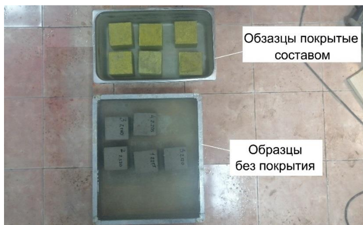
Рисунок 3 – Кубические образцы на водопоглощение [материал авторов]