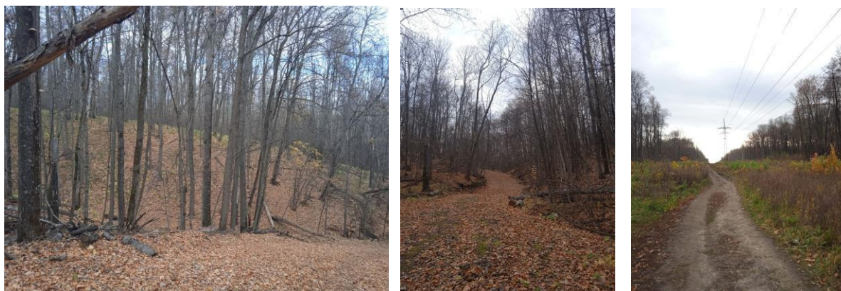
Рисунок 1

Первоначально назывался «Арбековский заповедник» и «Арбековская роща» (1920–1930 гг.). В 1965 году приобрел статус ботанического памятника природы регионального значения и стал называться «Арбековский лес».