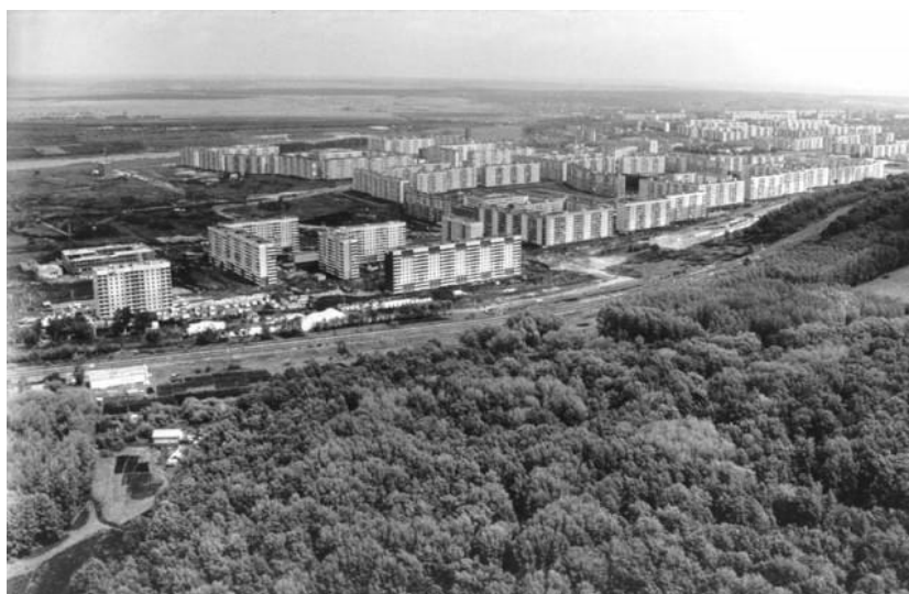
Рисунок 2 – Арбековский лес.

В настоящее время территория Арбековского леса полностью расположена в границах города Пензы, однако так было не всегда. Лишь в середине XX века эта территория перестала быть прилегающей к городу.