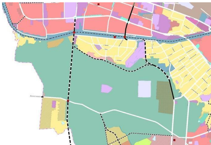
Рисунок 4 – Фрагмент Карты функциональных зон генерального плана г. Пензы. [7]

Необходимо отметить, что в 2019 г. были внесены изменения в генеральный план города Пензы и решением Пензенской городской Думы от 29.11.2019 № 54-5/7. По территории Арбековского леса с ул. Стасова через железную дорогу будет организована объездная автомобильная дорога вдоль микрорайона Автодром Вираз. Также выделены 2 участка под планируемое строительство малоэтажных жилых домов до 4 этажей, и индивидуальных жилых домов.