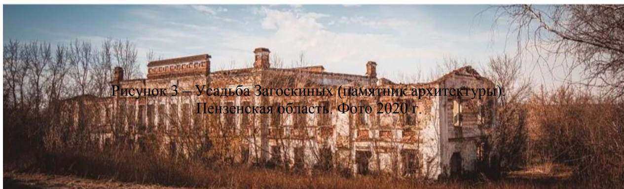
Рисунок 3 – Усадьба Загоскиных (памятник архитектуры). Пензенская область. Фото 2020 г.