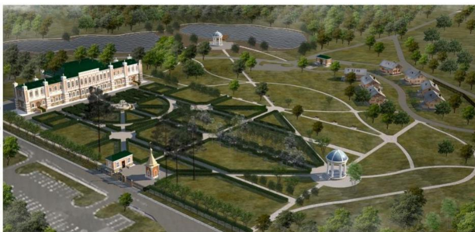
Рисунок 4 – Усадьба Загоскиных. Проект реконструкции [5].

Главный вход в усадьбу ориентирован на запад. Предусмотрено два автомобильных проезда на территорию объекта с трассы. Один ведет к входу на территорию усадьбы, с предусмотренными зонами парковки для легковых автомобилей и автобусной парковки. Через второй въезд осуществляется проезд к зоне загрузки и парковочным местам персонала, а также к рекреационной зоне с гостевыми домиками. Вокруг объекта предусмотрен беспрепятственный проезд, шириной 6 м. Центральный вход на территорию для удобства приближен к парковкам и задает одну из поперечных осей генплана.