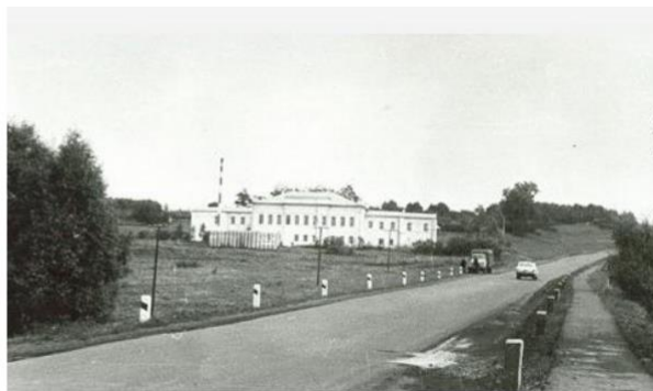
Рисунок 2 – Усадьба Загоскиных (памятник архитектуры). Пензенская область. Фото сер. XX в.