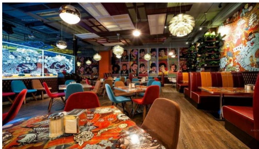
4-сурет – «Поп-арт» стиліндегі интерьер дизайны

Өз тенденцияларымен ерекшеленетін тағы бір стиль – поп-арт. Стиль жарқын, жарылғыш, бір жерде қатал. 60-шы жылдары АҚШ-та пайда болған ол бірден эмоциялардың дауылын тудырды – үлкен жарқын дақтар, әйгілі адамдардың түрлі-түсті бейнелері – портреттің академиялық кескіндемесінен мүлдем ауытқу тудырды. Түсімен, мөлшерімен және формасымен көзге түседі. Стиль үйдегі жайлылықтың ерекше индикаторымен ерекшеленбейді, өйткені жарқын дақтар кейде жалықтыруы мүмкін, дегенмен, интерьер дизайнын жасау кезінде поп-арт сәнді стильдердің бірі болды және болып қала береді (4-сур.) [9].