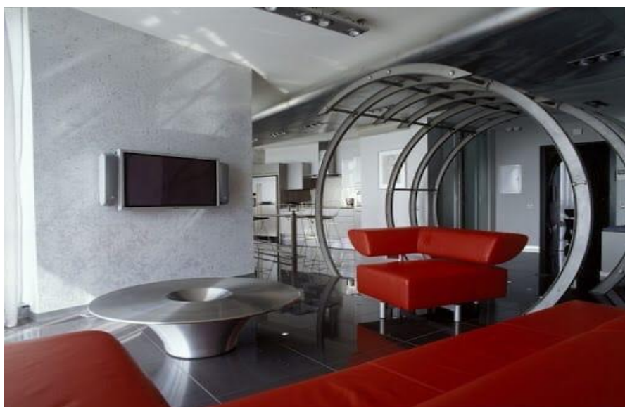
2-сурет – «Хай-тек» стиліндегі интерьер дизайны

Еуропада 70-жылдары пайда болған стиль хай-тек, басты принцип декор мен рационалдылықтың мүлдем болмауы болды. Хай-тек интерьердің басты ерекшелігі, тенденциясы металл заттардың болуы. Металл құбырлы шкафтар, металл негізді диван және басқа жиһаз бөліктері. Едендер, сондай-ақ қабырғалар монохроматикалық болуы керек. Геометриялық немесе гүлді оюдың немесе ою-өрнектің болуына ешқандай жолмен жол берілмейді (2-сур.) [7].