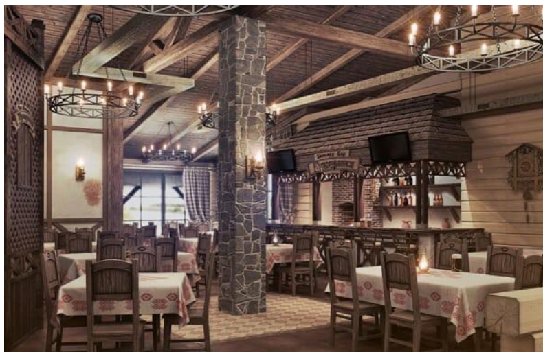
3-сурет – «Кантри» стиліндегі интерьер дизайны

Кантри американдық ранчомен, тау шалетімен немесе орыс саятшылығымен байланысты. Сәнді дизайнымен ерекшеленбейтін жұмсақ жиһаз, керісінше, ол әлдеқайда қарабайыр, «ескі» және кей жерлерде дөрекі. Ағаш едендер, декор элементі ретінде боялған плиталар және, әрине, стильдің танымал ерекшелігі – тоқылған тор, онда ешқандай күрделі, айналмалы ою-өрнектер жоқ, бәрі қарапайым (3-сур.) [8].