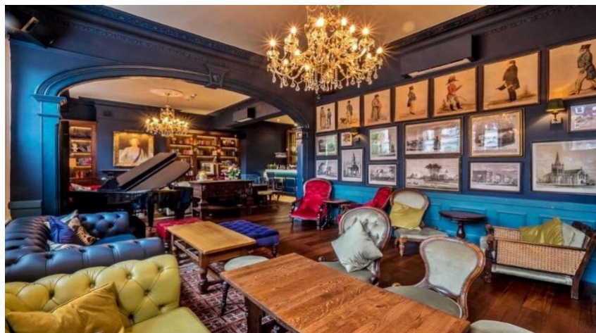
5-сурет – «Постмодернизм» стиліндегі интерьер дизайны

Ең таңқаларлық стильдердің соңғысы – постмодернизм (5-сур.) [10]. Стереотиптерден, кейбір канондардан және әдеттегіден бас тартуымен сипатталатын стиль. Ерекшеліктері – ашық түстер, ою-өрнектер, пішіндердің символикасы және текстуралар мен текстуралардың қарама-қарсы комбинациясы. Әдетте, бұл стильге қарапайым орналасуы бар кең бөлмелер сәйкес келеді. Бірақ бұл мейрамханалар, ойын-сауық орындары, салондар немесе ашық жоспарлы пәтерлер үшін қолайлы [2].