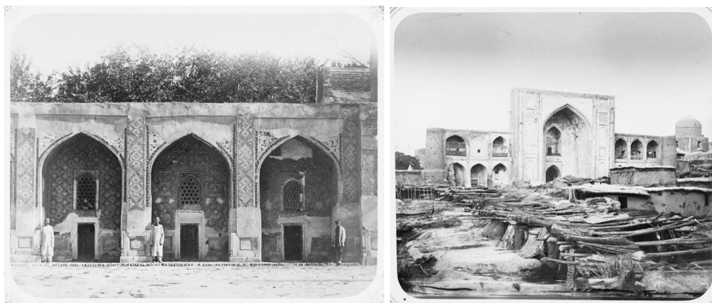
Рис. 1 – Вид одноэтажных келий, окружающих внутренний двор. Медресе Надыр-Диван-беги, Туркестанский край

Общая тенденция системы образования была следующей: медресе и монастырские школы, которые имели разные уровни, размеры и значения (большие и маленькие, городские и сельские, государственные, частные и т.д.). Уровень образования у них различался (рис.1).