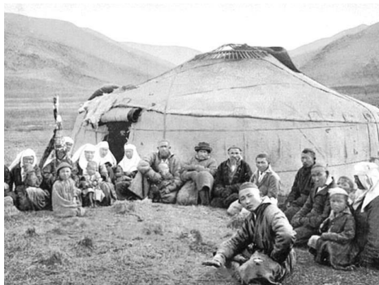
Рис. 2 – Семья казахов начала XIX века

В то же время необходимо подчеркнуть, что в казахских поселениях основным каналом передачи информации являются семейные узы (рис. 2).