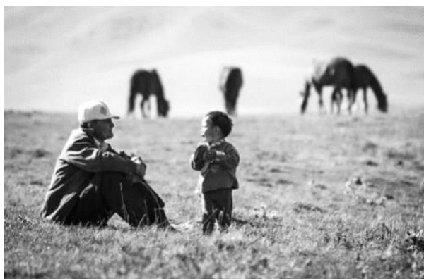
Рис. 3 – Культ почитания старшего

Традиционно выдающейся чертой казахской народной педагогики является культ почитания старшего поколения, культ матери и отца (рис. 3). В роли главных педагогов выступают именно старшие члены семьи – отец и мать, а также бабушки, дедушки и другие старшие родственники.