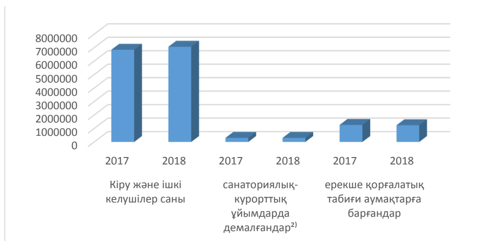
4-сурет – 2017-2018 жылдарға Қазақстан Республикасының бойынша келушілер саны

Бәсекеге қабілетті туристік индустрияны дамыту үшін Батыс Еуропа – Батыс Қытай халықаралық көлік дәлізін салу маңызды стратегиялық маңызға ие. Дәл осы көлік дәлізі шеңберінде еліміздің ұлттық туристік кластерін құру жоспарланып отыр, бұл республиканың туризміне тек Орталық Азия өңірінде ғана емес, Азия-Тынық мұхиты және Еуропа рыноктарында туристік нарықта өз орнын алуға мүмкіндік береді. Ұзындығы 2700 км аталған көлік дәлізі Қазақстанның бес облысының (Алматы, Жамбыл, Оңтүстік Қазақстан, Қызылорда және Ақтөбе) аумағы арқылы өтеді, оның жүру жолында бес миллионға жуық адам тұрады. Туристік кластерді құру шеңберінде көрсетілген көлік дәлізінің бойында жол бойындағы инфрақұрылымның 30 объектісін, әрбір 600 км сайын 8 мотельді ірі туристік кешендердің жобаларын салу қолға алынды.