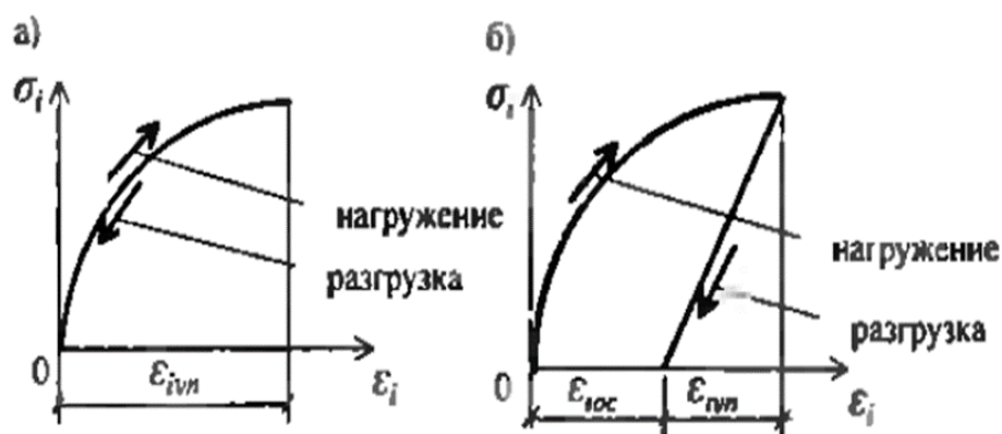
Рисунок 2 – Диаграммы деформирования физически нелинейного материала: а – нелинейно-упругий, б – упругопластический.

Точкой появления теории пластичности можно назвать момент проведения экспериментов знаменитого ученого Анри Эдуард Треска. В рамках своих экспериментов Анри Эдуард Треска изучал необратимое деформирование твердых тел. Это привело к появлению такого понятия, как пластическая деформация. Также им был сделан вывод о существовании некой характеристики исследуемого объекта, которая выражает такое максимальное значение касательных напряжений, при котором материал переходит в пластическую стадию работы.