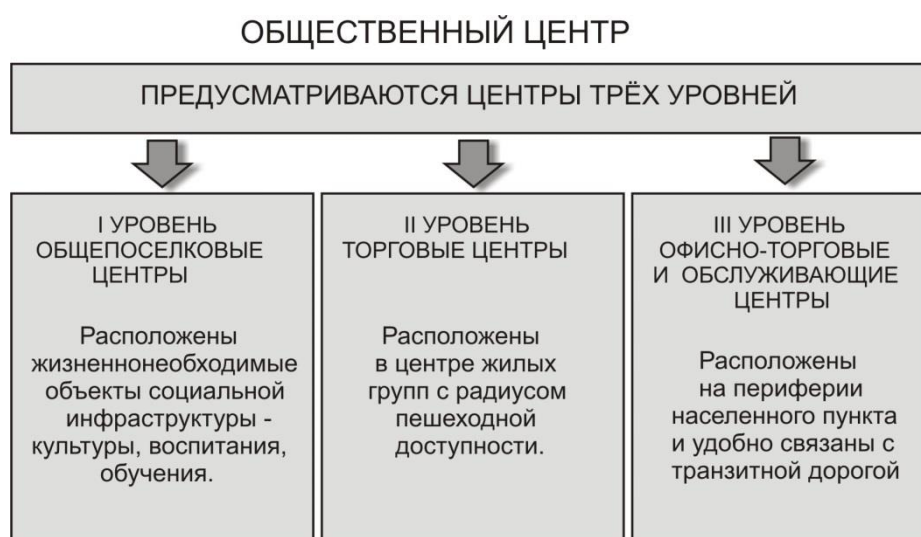
Рис. 1 – Классификация центров трех уровней

Центры третьего уровня – офисно-торговые и обслуживающие центры (подцентры), которые размещены на периферии населенного пункта и удобно связаны с транзитными дорогами (рис. 1).