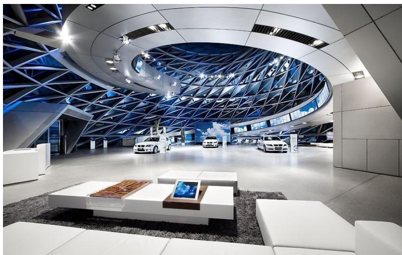
2-сурет – «Хай-тек» стиліндегі интерьер дизайны

дегі интерьерлер нақты, сонымен қатар ыңғайлы. Суреттер де, декор элементтері де жоқ. Қабырға, төбенің және еденнің беткі қабаттары тегіс және таза болуы керек, сондықтан жиһаздар, маталар мен ыдыс-аяқтар сәйкес келуі керек. Мұндай интерьерде жеңіл, айқын геометриялық пішіндермен бәрі орынды болады. Хромдалған металдан және синтетикалық былғарыдан жақсы таңдалған орындықтар, креслолар немесе дивандар өте талғампаз және ыңғайлы көрінеді. Жоғары технологиялық интерьердегі шкафтың орнына жабық және ашық бөлімдері бар сөре модульдерін қойған дұрыс. Барлық металл жиһаздар мен аксессуарлар күміс түстес және жылтыр болуы керек (2- сур.) [7].