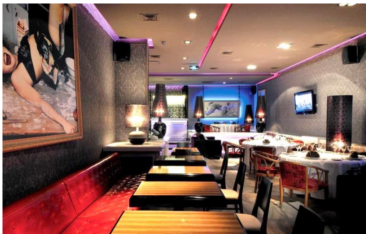
3-сурет – «Фьюжн» стиліндегі интерьер дизайны

Дәстүрлі емес және эмоционалды, таңқаларлық және артық синтездеу стилі – бұл декорацияның нағыз шедеврi. Бұл стиль көбіне өзіне сенімді, күнделікті қарапайым өмірін ерекше және пайдалы етіп өткізуге тырысатын адамдарға ұнайды [2] (3-сур.) [8].