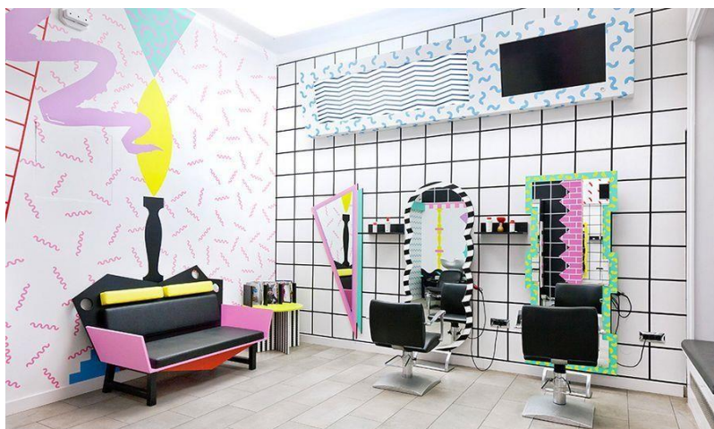
1-сурет – «Авангард» стиліндегі интерьер дизайны

Жиһаз да әсерлі болуы керек. Пішін қатаң геометриялық болуы мүмкін, контуры қажет емес бөлшектерсіз. Авангард кішкентай декор мен безендіруден аулақ болады. Металдан, ағаштан, әйнектен жасалған жиһаз интерьерге толық сәйкес келеді. Айқын нысандар мен дизайнердан басқа, мүлдем аморфты нысандар, мысалы, жастықтары бар үлкен орындықтар ерекше әсерлі болады (1-сур.) [6].