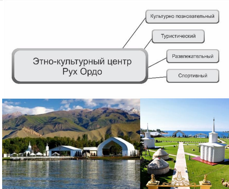
Рис. 5 – Этнокультурный Центр «Рух Ордо», Кыргызстан. Общий вид

Этнокультурный Центр «Рух Ордо» (им. Ч. Айтматова). Данный комплекс расположен в городе Чолпан-Ата на северном берегу оз. Иссык-Куль.