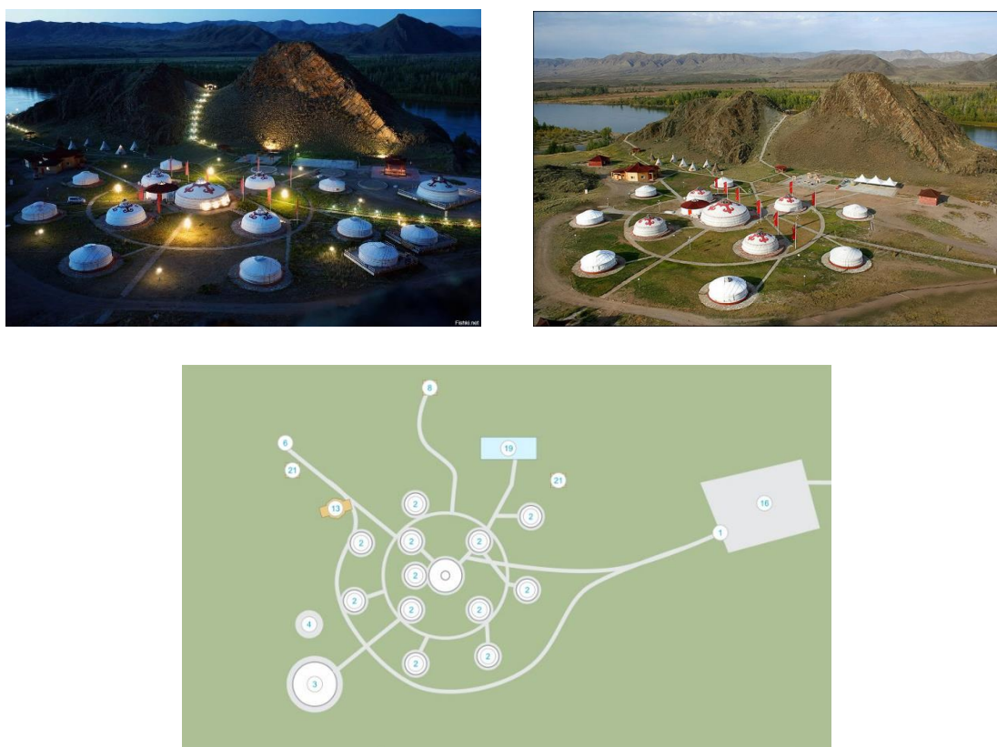
Рис. 4 – Этнотуристический комплекс «Алдын-Булак» (Республика Тыва)

Данные предположения подтверждают найденные артефакты. В ходе археологических раскопок были обнаружены камни с тибетскими мантрами и обломки ханской печати. Проект комплекса имеет интересную компоновку. Композиция расположения юрт построена на сочетании радиально-кольцевой и радиально-комбинированной планировочной схеме (рис. 4).