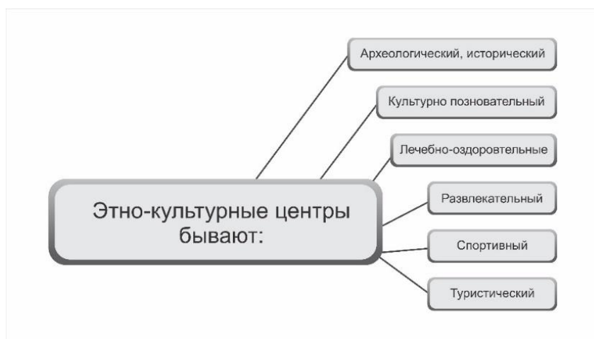
Рис. 1 – Типология этнокультурных центров

Планировочная схема достаточно разнообразна (рис. 2). Основные варианты планировочной композиции сложились в зависимости от назначения и расположения.