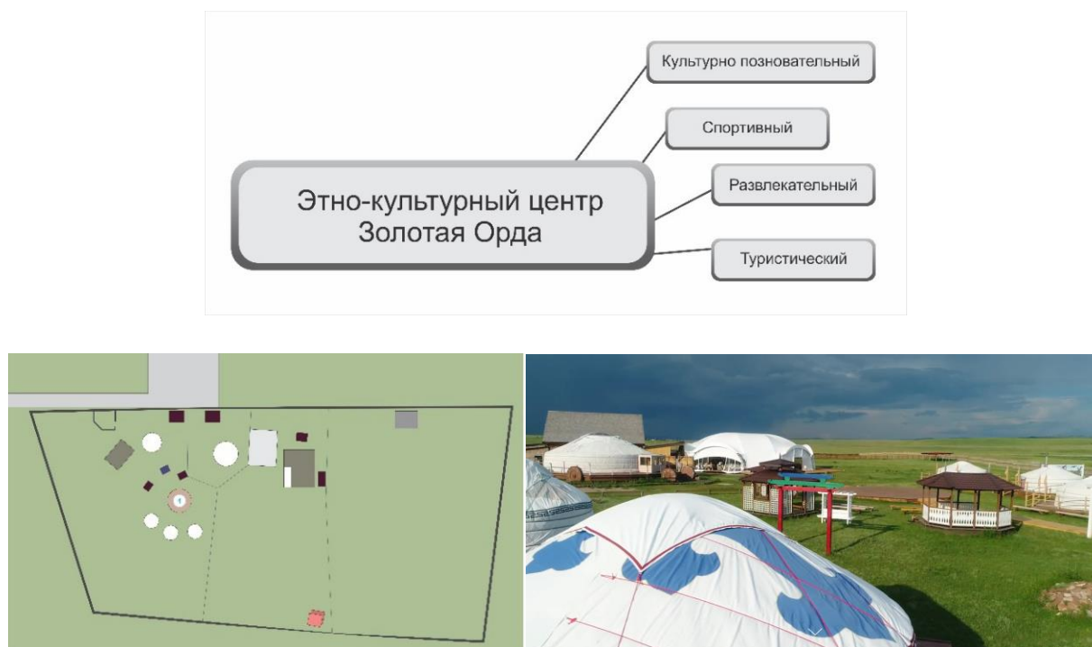
Рис. 7 – Этнокультурный парк «Золотая орда», Российская Федерация.

В этнокультурном комплексе « Золотая Орда » предусмотрены следующие функциональные зоны: