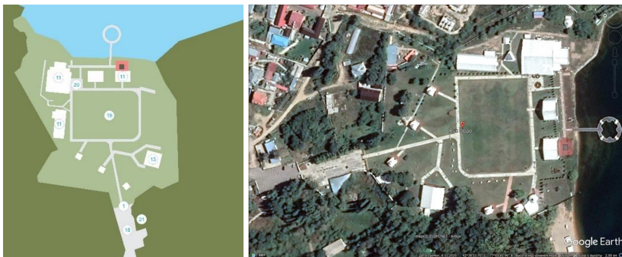
Рис. 6 – Этнокультурный комплекс «Рух Ордо», Кыргызстан

Планировочная система этнокультурного комплекса «Рух Ордо» соответствует лучевой схеме (рис. 6).